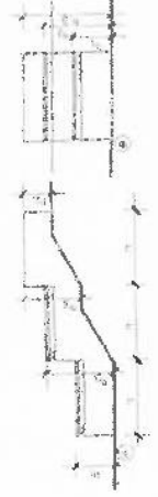
4. SZÁM PÉLDA