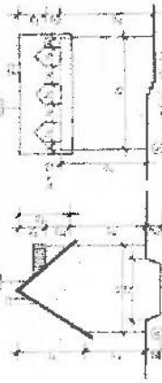
1. SZÁM PÉLDA