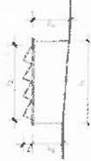
2. SZÁM PÉLDA

Figyelem! A képekben a mértékegységek nem szerepelnek, ezért a számításoknál a mértékegységet a feladat szövegéből kell meghatározni.