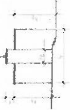
5. SZÁM PÉLDA