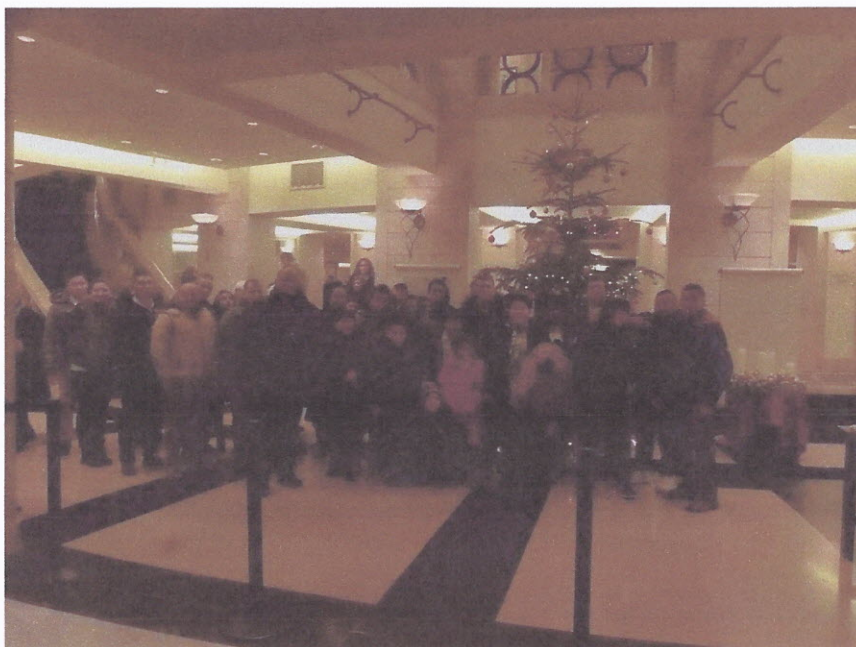
Nemzeti Színház Budapest – Somnakaj Gypsy Musycal