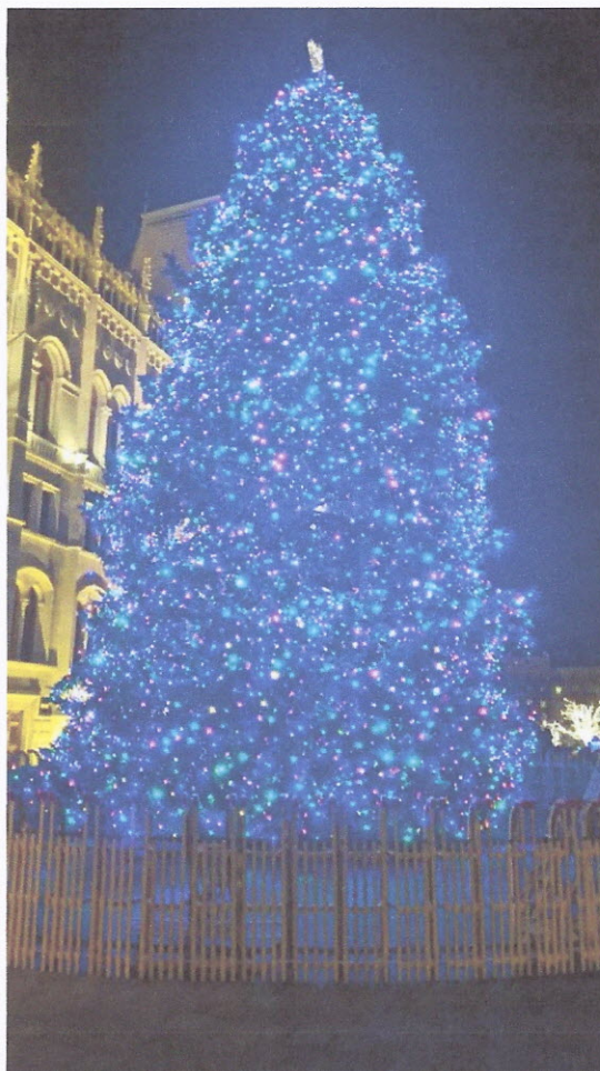
Kossuth tér – az ország karácsonyfája