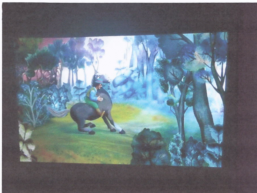
Cigány mese vetítés