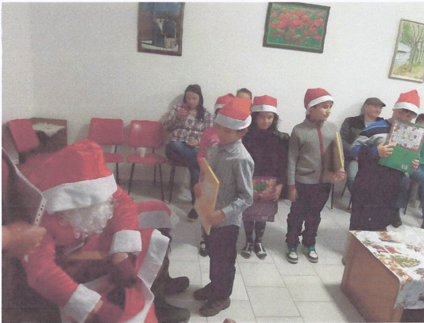
Megjött a Mikulás!