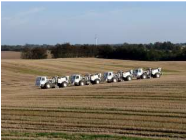
Munkatársaink ilyen önjáró vibrátor járművekkel keltenek mesterséges rezgéseket

Az engedélyeztetésért felelős bányászati, geológiai kutatási és tanácsadó tevékenységre specializálódott magyar cég, a TDE Services Kft. minden illetékes hatóságot megkeresett a szükséges engedélyek beszerzéséért, a kutatással érintett ingatlantulajdonosokat és -használókat pedig levélben értesítette, majd személyesen is felkeresi.