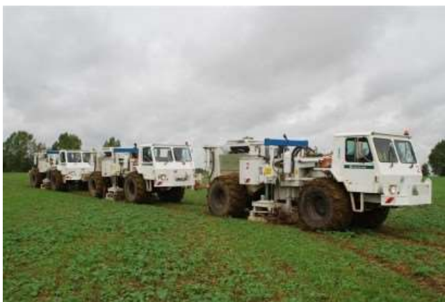
Ilyen önjáró vibrátor járműveket láthat a kutatási területen