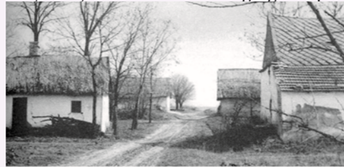
Sorba rendeződött szállás-épületek (Uszód-Hanyik, Bács-Kiskun m., 1970-es évek)